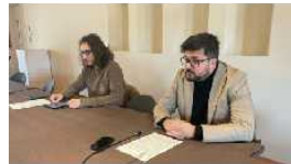
Marostica: proseguono gli investimenti per la digitalizzazione