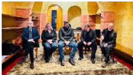
Marostica: mostra immersiva su Caravaggio e nuovi spettacoli teatrali